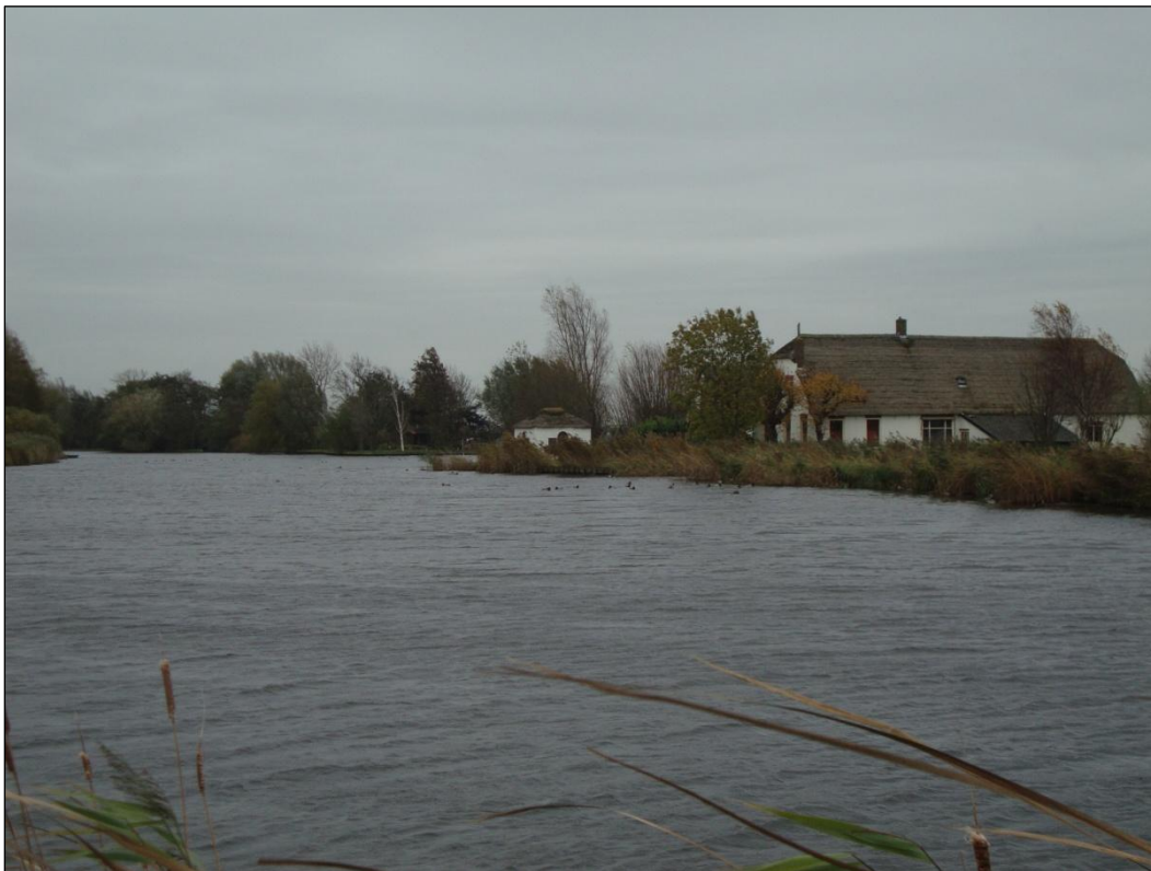
Foto: Een blik op het lint vanaf de Drecht.

Naast adviezen is het ook belangrijk dat de schop in de grond gaat! Verschillende bewoners worden al professioneel bijgestaan bij de uitvoering van de plannen die zij in overleg met Landschapsbeheer Zuid-Holland hebben gemaakt. De provincie Zuid-Holland en de gemeente Kaag en Braassem hebben subsidie beschikbaar gesteld om onder andere kosten voor plantmateriaal deels te vergoeden.